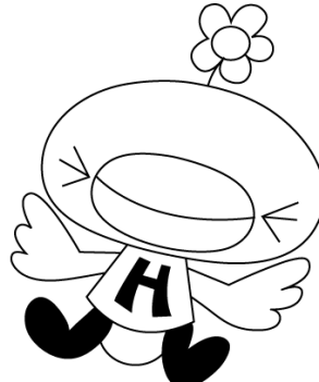
東苗穂児童会館キャラクター ひなこ

《開館日・時間》 月曜日～土曜日 午前8時45分 ～午後6時 ※ふり→たいむ(中・高校生夜間開放)の日は午後9時まで